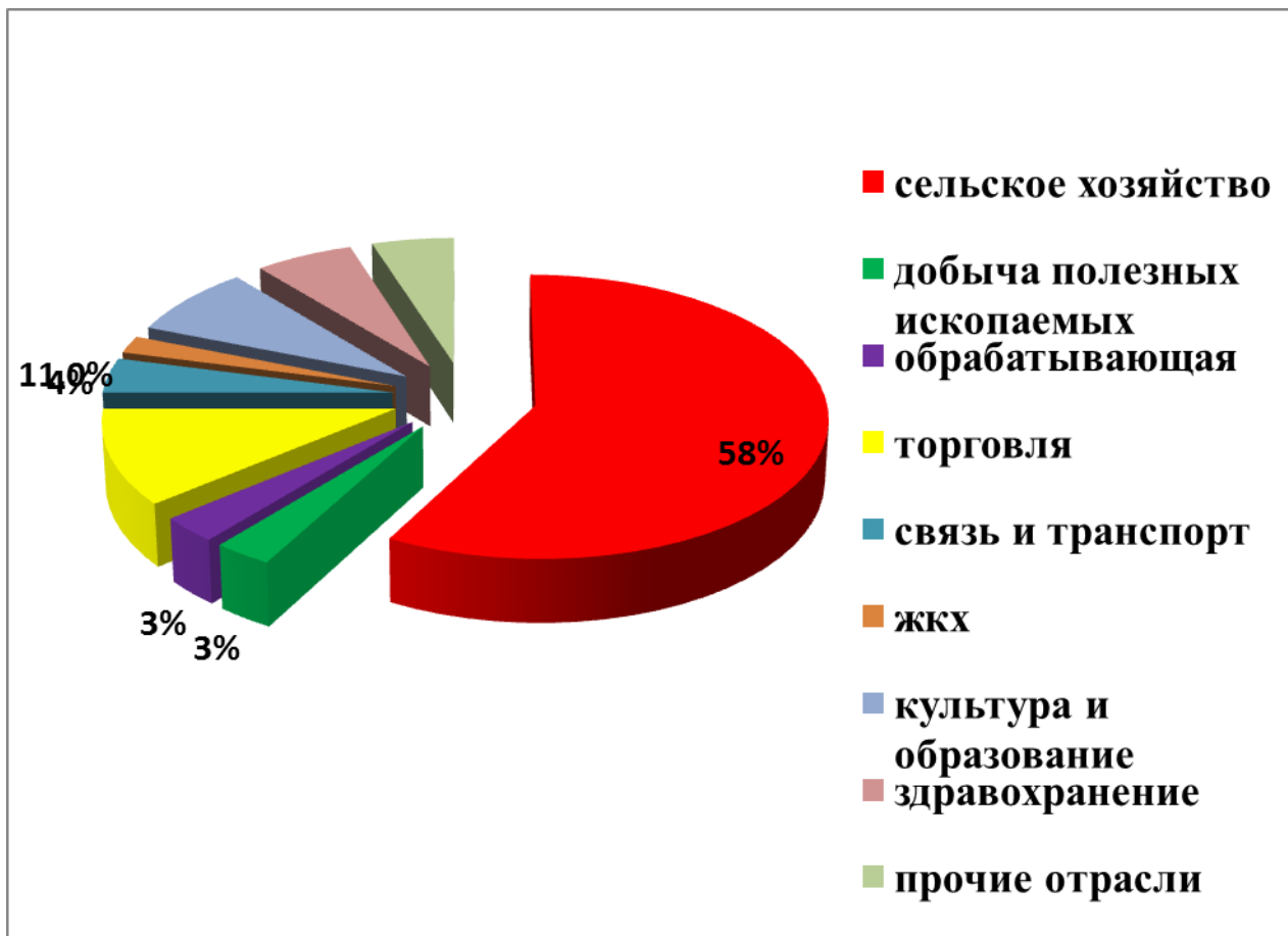
Приложение.3. Диаграмма№2. «Структура занятости населения Иссинского района»